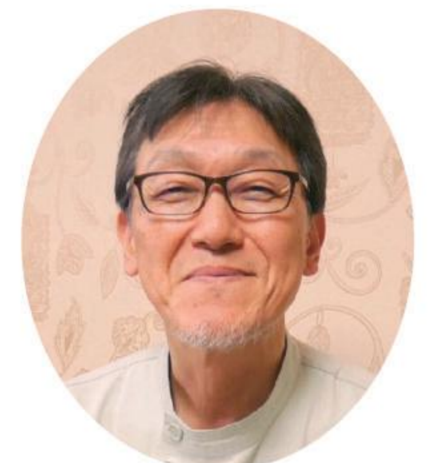
みわレディースクリニック院長

マンモグラフィは乳房のレントゲン。 プラスチックの板と撮影台に乳房をはさん で撮りますが、1回にかかる時間は5秒程度、 これを4回繰り返すだけです。 「マンモグラフィーって痛そう」という声を聞 くことがありますが、アンケートによれば 90%以上の方が、「痛くなかった」、「ガマン 出来る程度だった」と答えています。 「乳がんって言われたらどうしよう」 そんなモヤモヤをかかえていませんか？ 乳がんは多くの場合、治る病気です。 2年に1度のマンモグラフィ検診と、月に 1度の自己検診が早期発見につながります。 マンモグラフィ検診、受けてみようかなと 思ったあなた、あなた自身とあなたの 大切な人のために、是非一歩踏み出して みて下さいね。